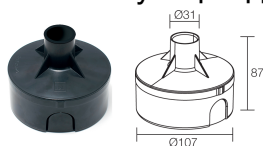
WC0202 Монтажный короб