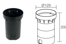
WC0701 Монтажный короб