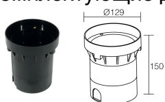
WC0601 Монтажный короб