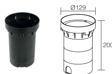
WC0701 Boîtier d'encastrement