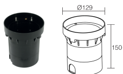
WC0601 Boîtier d'encastrement