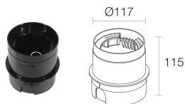
WC0105 Boîtier d'encastement