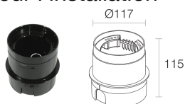
WC0105 Boîtier d'encastement