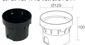
WC0501 Caja de empotrar