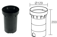
WC0701 Caja de empotrar