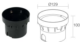
WC0501 Caja de empotrar