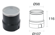
WC4050 Caja de empotrar